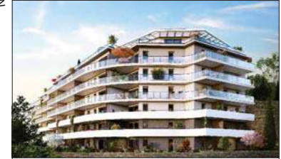
41 Boulevard Guynemer - 06240 - BEAUSOLEIL